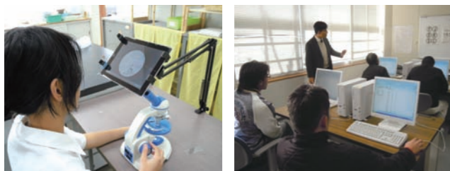
見えにくい生徒も使える顕微鏡