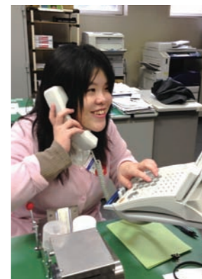
外部からの電話に明るく対応