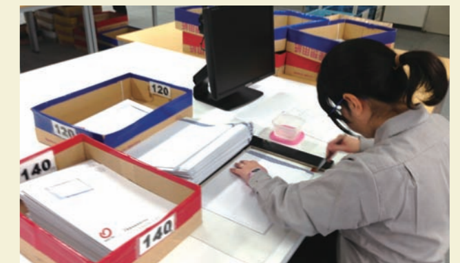
治具(ジグ)を使用してのり付けをしているところ