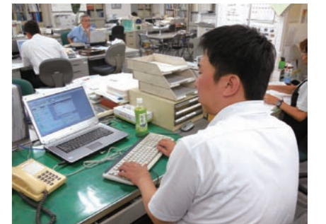
自分を高める努力を続け、仕事の領域を広げている