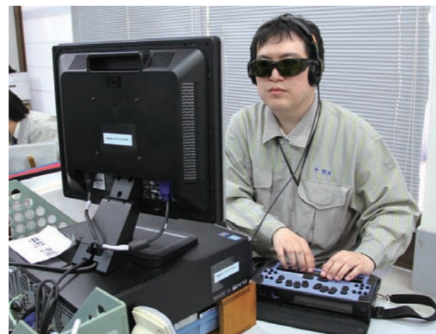
音声を聞きながら、点字ディスプレイを使ってパソコンを操作