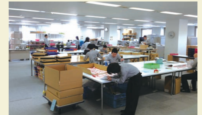
すっきり整理された職場環境

また、彼女の明るく気持ちの良い挨拶や返事は、職場を明るくしてくれる力を持っていました。