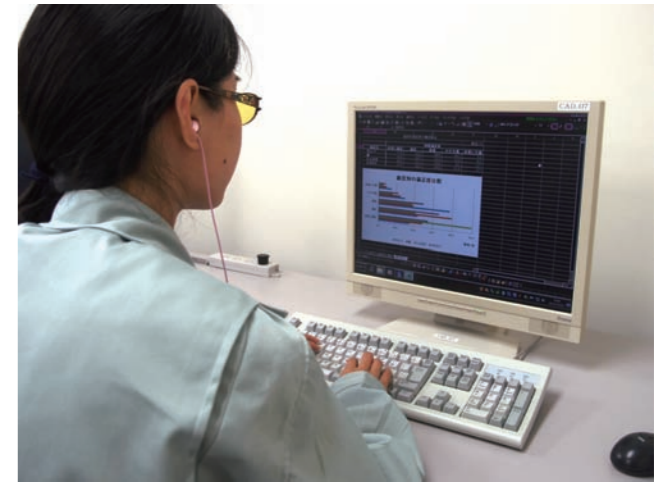
音声パソコンを利用し、エクセルでグラフを作成