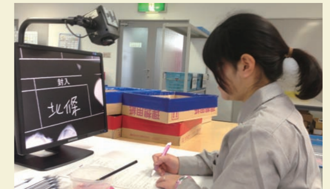
拡大読書機を使用し記名を行っているところ