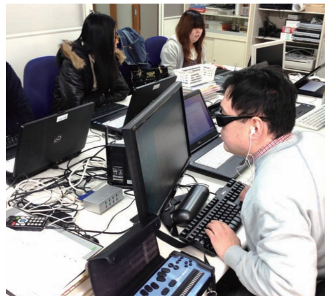
全盲者の講師によるパソコン研修

では、視覚障害者は、どのように通勤し、職場内を移動し、パソコンなどのIT機器を使って業務を行うのでしょうか。