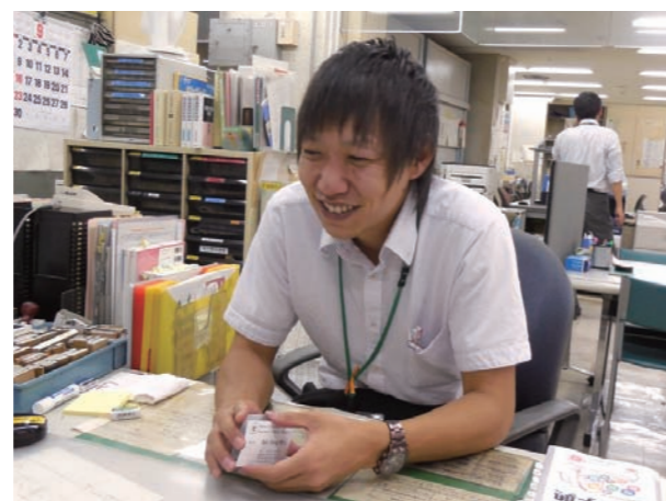
見えにくいことを顧客に伝え、窓口業務もスムーズに対応している

勤務先／〒812-0016 福岡市博多区博多駅南1-3-24 リファレンス博多1004