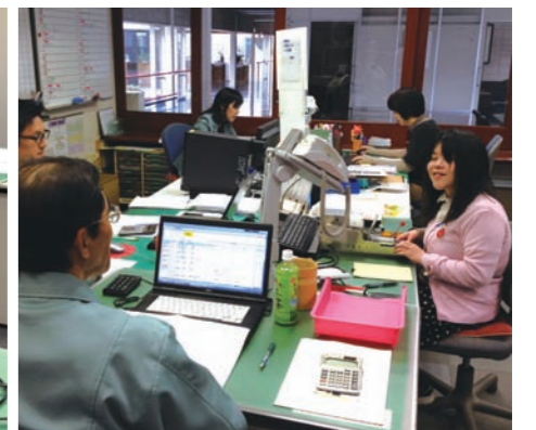
同じ部署で仕事をしている人たちと一緒に